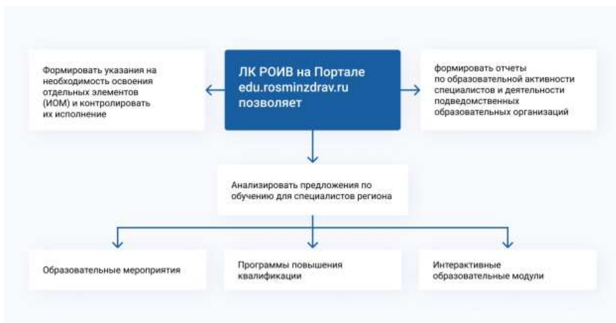
Схема 6. Возможности пользователя ЛК РОИВ

С 2020 года на Портале edu.rosminzdrav.ru доступен функционал Личного кабинета регионального органа исполнительной власти в сфере охраны здоровья (ЛК РОИВ). Работа в ЛК РОИВ предоставляет пользователям ряд возможностей использования данных Портала (схема 6).