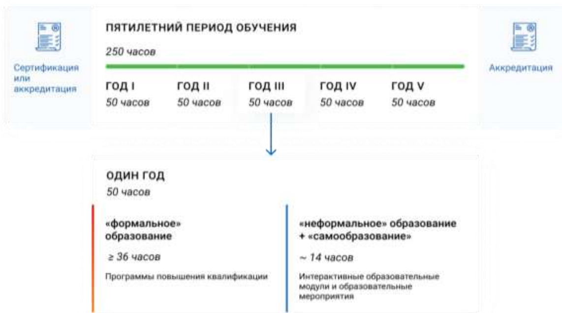
Схема 4. Рекомендуемый объем и график обучения в непрерывном образовании

Для восполнения пробелов в полученных ранее компетенциях, а также получения новых знаний, умений и навыков наиболее эффективным является обучение по программам повышения квалификации. Поэтому из общего рекомендуемого ежегодного объема обучения примерно в 50 ЗЕТ на долю освоения образовательных программ в рамках «формального образования» рекомендуется отводить примерно 36 ЗЕТ. Оставшийся объем образовательной активности (примерно 14 ЗЕТ) рекомендуется наполнять образовательными элементами «самообразования» и «неформального образования» (схема 4).