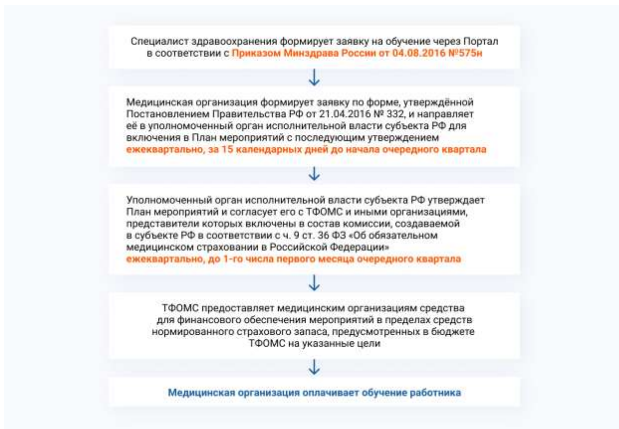
Схема 5. Координация действий при финансировании обучения из средств НСЗ ТФОМС