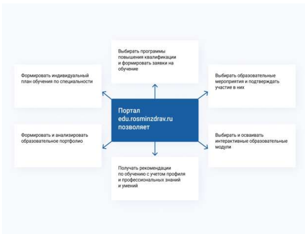
Схема 3. Возможности специалиста здравоохранения при работе на Портале

Зарегистрированные пользователи Портала получают доступ к широкому спектру возможностей по планированию и осуществлению своего обучения (схема 3).